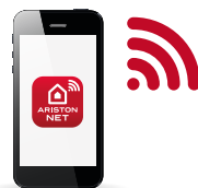
APP GRATUITA PER IL CONSUMATORE