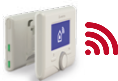
GATEWAY + SENSYS NET